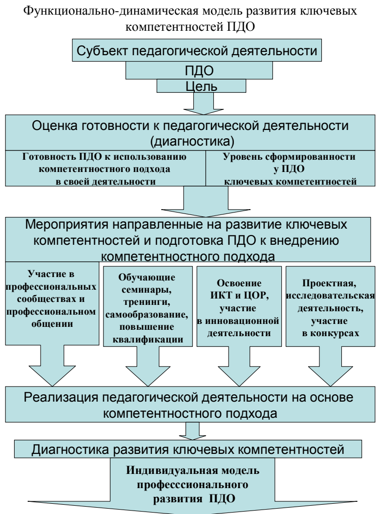
Рис. 1. Функционально-динамическая модель развития ключевых компетентностей ПДО

ной компетентности педагогов дополнительного образования. Проблема, с которой мы сталкиваемся в реальности, состоит в отсутствии в нашем городе и области ВУЗов и СУЗов осуществляющих подготовку профильных кадров для детско-юношеского туризма. Одновременно приходят кадры, не имеющие специального педагогического образования. А это ведет к снижению общего профессионального уровня педагогов и кадровой нестабильности. Поэтому система ступенчатой подготовки педагогов дополнительного образования является важной для развития учреждения и позволяет «выращивать» квалифицированные кадры внутри учреждения.